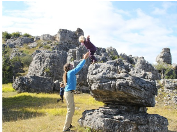
Bild: Tausende kleine Felsen zum Staunen und Besteigen

Beschreibung: Vom Parkplatz bei Gally geht es an den Häusern vorbei und den Markierungen folgend auf einem Rundweg durch die vielen kleinen und größeren Felsformationen, die zum Bouldern, Klettern und Staunen locken. In L'Hom wendet der Weg und führt in einer südlichen Schleife zurück zum Parkplatz. Obwohl es nur knapp 4 Kilometer sind, sollte man sich ausreichend Zeit zum Kraxeln und Genießen lassen und sicher findet sich auch ein toller Platz auf oder unter einem Felsen zum Rast.