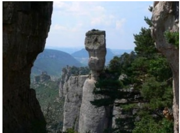
Bild: Eine der faszinierenden Felsformationen über der Jonte

Beschreibung: Die Geierwanderung Diese Wanderung bietet ganz Besonderes, nämlich frei lebende Geier und schönste Ausblicke in die Schluchten des Tarn und der Jonte. Nach etwa 40 km Anfahrt aus der Tarnschlucht über Ste. Enimie, Col de Coperlac (auf dem Causse Méjean), La Parade, La Volpierre und St. Pierre des Tripers, lässt man die Fahrzeuge auf dem Parkplatz etwa 200 m vor dem kleinen Weiler Cassagnes stehen und wandert zum Ort. Nach dem letzten Haus geht es zur ersten Wegegabelung. Hier folgt man dem markierten Weg nach rechts zur Kante über der Tarnschlucht und wandert die Runde gegen den Uhrzeigersinn über dem Tarn, dann über den Felsen der Jonteschlucht und durch den Wald zurück nach Cassagnes. Die Runde kann - wie beschrieben - gegen den Uhrzeigersinn, aber auch anders herum gewandert werden. Das dürfte Geschmackssache sein. Als Höhepunkte warten auf jeden Fall die Blicke von oben in die Schluchten, viele imposante Felsmassive und die "Begegnung" mit Geiern und Kletterern in der Jonteschlucht. Für besonders Wagemutige und Trittsichere kann noch der Sentier J. Brunet ergänzt werden, der eine weitere Schleife beim Übergang von der Tarn- zur Jonteschlucht bereit hält. Viel Spaß beim Nachwandern!