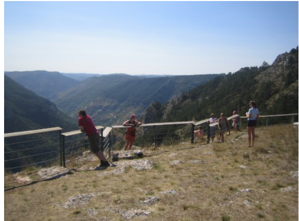
Bild: Aussichtspunkt in Les Boissets